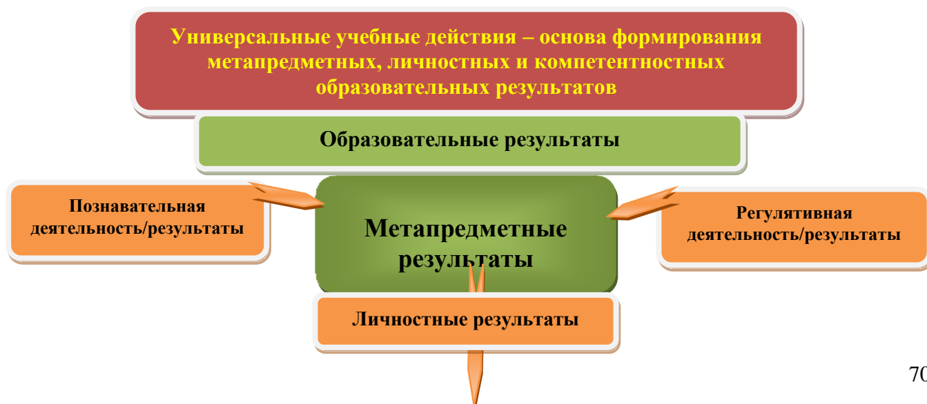
Рис. 2. Система оценки образовательных результатов

Система оценки достижения планируемых результатов освоения основной образовательной программы основного общего образования предполагает комплексный подход к оценке результатов образования, позволяющий вести оценку достижения обучающимися всех трех групп результатов образования: личностных, метапредметных и предметных (рисунок 2.).